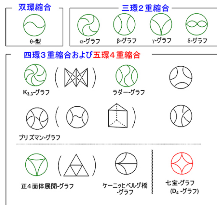
図1. 五環4重縮合トポロジーの七宝文様高分子(赤で表示)と関連する多環状多重縮合構造高分子の「かたち」(なお、当研究室でこれまでに合成された高分子を緑で表示している)

さらにこのESA-CF法と新しい有機合成化学手法(クリック法やクリップ法など)を組み合わせ、新奇トポロジー高分子を自在に提供するブレークスループロセスの開発を進めてきた。